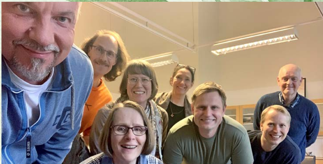
Kuvassa on Hengen uudistuksen kouluttamia mentoreita yhteisönrakentajille. Elämänpyörä on yksi työkalu, jota he käyttävät työssään.

4. Muuta lopuksi pohdintasi rukoukseksi. Kiitä siitä, mikä on hyvin. Pyydä anteeksi sitä, missä et ole antanut Jumalan hallita elämääsi. Usko armoon ja pyydä Jumalaa johtamaan elämääsi kohti hänen suunnitelmaansa.