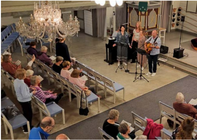
Sanan ja rukouksen äärellä pääsee myös kohtaamaan toisia.