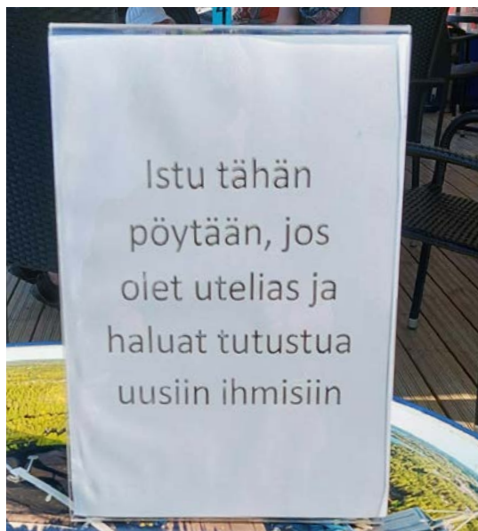
Joskus ratkaisu on yksinkertainen!

Jotta uudet ihmiset saadaan jäämään yhteisöön on luotava johdonmukainen prosessi, joka helpottaa